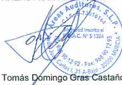
Tomás Domingo Gras Castaño Socio-Auditor de Cuentas Nº ROAC S1324