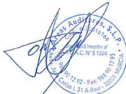
Tomás Domingo Gras Castaño Socio-Auditor de Cuentas Nº ROAC S1324