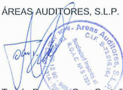
Tomás Domingo Gras Castaño Socio-Auditor de Cuentas Nº ROAC S1324